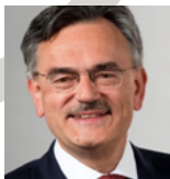
Prof. Dr. Dr. h.c. mult. Wolfgang A. Hermann Präsident, TU München

„Die Mission der TU München ist es, junge Menschen unmittelbar am Forschungsgegenstand auszubilden – und nicht für den Elfenbeinturm.“